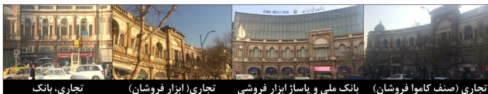
شکل ۳. میدان حسن‌آباد تهران

جای آن ساخته شد. این ساختمان متعلق به بانک ملی ایران بوده و اخیراً در پی بازسازی میدان در جلوی این نمای شیشه‌ای، سازه‌ای نمایشی شبیه به نمای دیگر بناهای میدان ساخته شد تا تمامیت فضای اولیه معماری میدان تا حدی بازگردد (شکل ۳). در ادامه و در جدول (۲ و ۳) به بررسی مدل عوامل تشکیل‌دهنده هویت مکانی در دو میدان ایالت و میدان حسن‌آباد پرداخته می‌شود.