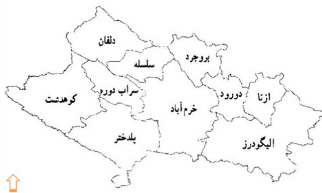
شکل ۱. موقعیت شهرستان‌های استان لرستان (یاری و همکاران، ۱۳۸۹)

مدل‌ها و نرم افزارها و شاخص‌های مورد استفاده در پژوهش: در تحقیق حاضر از مدل‌های ضریب جینی ۶ ، ضریب