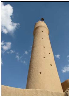
شکل ۸- مناره خشتی مسجد

ورودی فعلی مسجد در سمت جنوب غربی بنا و دو در ورودی دیگر که یکی باز و دیگری مسدود است، در سمت شرقی مسجد قرار دارند (شکل ۹). شبستان مسجد و هردو سمت شرقی و غربی آن که در امتداد رواق می‌باشند، بوسیله طاق‌های گهواره‌ای پوشیده شده‌اند. رواق شمالی با نیم گنبدهایی که هریک از آنها دارای گوشه‌سازی‌های بیضی شکل کوچکی می‌باشند، مسقف گردیده است (شکل ۱۰).