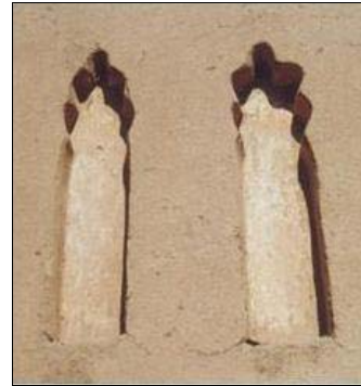
شکل ۱۴- جفت قوس تزئینی

متون تاریخی مانند فتوح البلدان (قرن ۳ق/۹م)، تاریخ طبری (قرن ۴ق/۱۰م) و امثالهم با فاصله زمانی نسبتاً طولانی از حوادث قرن اول هجری به تحریر در آمدند. این عدم همزمانی فقط اطلاعات کلی را بدون هیچ نوع جزئیات در مورد رخ دادهای معماری در اختیار ما قرار می‌دهد. بطور مثال وقتی سپاه اسلام تیسفون پایتخت چهارصد ساله ساسانیان را در سال ۱۶ق/۶۳۷م فتح نمود، به دستور سعدابن ابی وقاص فرمانده سپاه اسلام، مسجدی در ارگ تیسفون به شکرانه این