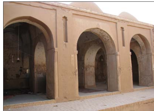
شکل ۵- نمای شبستان