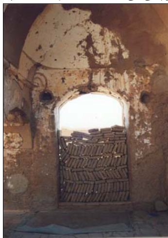
شکل ۹- ورودی مسدود شده مسجد

ورودی فعلی مسجد در سمت جنوب غربی بنا و دو در ورودی دیگر که یکی باز و دیگری مسدود است، در سمت شرقی مسجد قرار دارند (شکل ۹). شبستان مسجد و هردو سمت شرقی و غربی آن که در امتداد رواق می‌باشند، بوسیله طاق‌های گهواره‌ای پوشیده شده‌اند. رواق شمالی با نیم گنبدهایی که هریک از آنها دارای گوشه‌سازی‌های بیضی شکل کوچکی می‌باشند، مسقف گردیده است (شکل ۱۰).