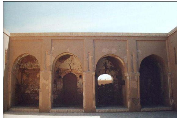
شکل ۶- نمای مقابل شبستان

همانطور که تصویر سه بعدی بنا نشان داده می‌دهد (شکل ۷)، ارتفاع شبستان به عنوان مهمترین بخش مسجد از سایر بخش‌های آن بیشتر است. از طرفی حیاط مسجد کاملاً مربع نیست و بخش شمالی اندکی از بخش جنوبی پهن‌تر می‌باشد، بنابراین به منظور پوشش این قسمت عریض‌تر که باید در طراحی ارتفاعش کمتر از شبستان نیز باشد، احداث چهار دهانه رواق ضروری بوده است. در سمت شمال غربی بنا، مناره استوانه‌ای شکل به همراه تعدادی اطاق در کنار آن مشاهده می‌شوند (شکل ۷). این مناره که از آجرهای خشتی ساخته شده دارای پلکانی مارپیچ و ورودی آن به داخل رواق باز می‌شود. به نظر می‌رسد که این مناره، مناره‌ای مستقل نبوده و بعدها به مسجد اضافه گردیده است هر چند که هنوز دلیل متقنی در مورد تاریخ ساختش وجود ندارد (شکل ۸). مرحوم پیرنیا تاریخ ساخت این مناره الحاقی را که قرن ۴ق/۱۰م و یا قرن ۵ق/۱۱م ذکر می‌کند (پیرنیا، ۱۳۴۹، ۳) و مهرداد شکوهی نیز ساخت آن را قبل از قرن ۴ق/۱۰م نمی‌داند (Shookaohg, 1978, 73). اطاق‌های مجاور مناره نیز احتمالاً بر روی پی‌ها اطاق‌های قدیمی‌تر بازسازی شده‌اند، اما عملکرد اولیه آنها مشخص نیست.