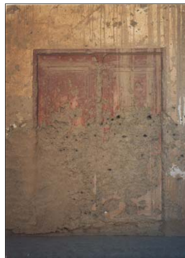
شکل ۱۶- نمای یک در تزئینی