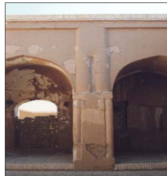
شکل ۱۵- طرح تزئینی شیاری شکل

در قسمت شمالی حیاط نیز، سه طرح به شکل شیارهای عمودی با قوس تیزه داری در بالای هر یک، در نمای رواق دیده می‌شوند (شکل ۱۵). سه طرح تزئینی به شکل در ورودی که هر یک از آنها ۱/۷۹ متر پهنا و ۲/۴۸ متر ارتفاع دارند در قسمت شرقی بنا، زیر رواق قرار دارند. این درها به سختی آسیب دیده‌اند ولی بقایای گچبری قرمز رنگ بر روی یکی از مشهود است (شکل ۱۶).