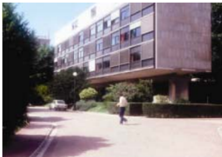
شکل ۱- نمونه سویس در نمایشگاه بین‌المللی پاریس، ۱۹۳۰، لوکوربوزیه قرارگیری ساختمان بر روی پیلوت، بهره‌گیری از پلان آزاد و نماهای شیشه‌ای

پیکربندی‌های نامنظم را با بهره‌گیری از تکنولوژی در اواخر قرن نوزدهم فراهم آورد. دید تاریخ گرایانه حاکم بر قرن نوزدهم که ساختمان‌ها را به سوی بهره‌گیری از پیکربندی‌های منظم سوق می‌داد در اوایل قرن بیستم از سوی تعدادی از معماران پیشرو به ویژه در اروپا مورد حمله قرار گرفت؛ معمارانی که اعتقاد به دمیدن روح زمان و تکنولوژی عصر خود در کالبد معماری داشتند. بعدها این جنبش به سبک بین‌المللی معروف شد. نمونه بارز این سبک غرفه سویس در نمایشگاه ۱۹۳۰ پاریس است.