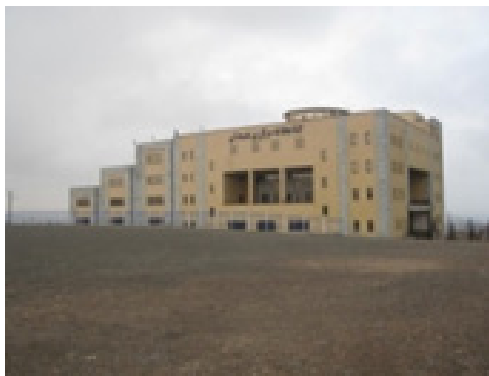
شکل ۲. چشم‌انداز خارجی به نمای جنوبی کتابخانه مرکزی همدان