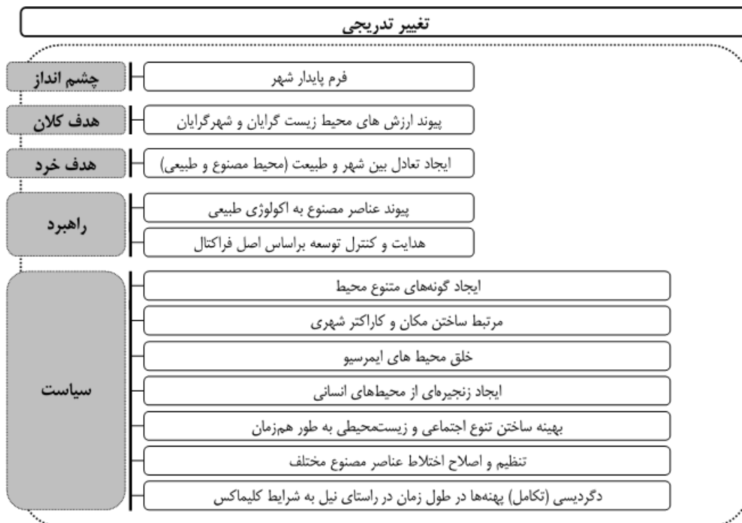
شکل ۳. سلسله‌مراتب اصول منتج از رهیافت تغییر تدریجی

در سطح دوم انطباق، مؤلفه‌های تغییر تدریجی مبتنی بر اصول پایه اکولوژی شکل می‌گیرند. به همین منظور، ابتدا تفسیر مؤلفه‌های استخراج‌شده براساس مفاهیم پایه اکولوژی در هر دو نظام اکولوژی و تغییر تدریجی بررسی می‌شوند و از مقایسه و تطبیق آنها، نقاط لنگرگاهی هر مؤلفه شناسایی می‌شود. مقصود از نقاط لنگرگاهی مسائلی از هر مؤلفه است که بنیاد آن مفهوم را می‌سازند و در حقیقت