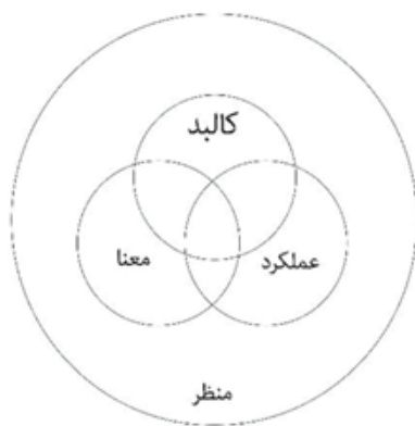
شکل ۱. مدل مفهومی منظر.

فرهنگی به معنای محصولی انسان‌ساز در یک دوره تاریخی تلقی شود. دستاورد آن، تمدن است، لذا محصول تمدن‌های گذشته متعلق به سرزمین و دوره خاص خود است. بدین گونه مظهر شناخت دوره و دارای ارزش خواهد بود؛ اما اگر تمدن معاصر که به دنبال فرهنگ مدرنیسم شکل گرفته، مشمول این تعریف قرار گیرد، مفهوم فرا سرزمینی پیدا می‌کند (متدین، ۱۳۹۳، ۴۳). تایلر آدر سال ۱۸۷۱ در کتاب «فرهنگ ابتدایی» تعریفی جامع از فرهنگ را ارائه کرده است: «فرهنگ مجموعه پیچیده‌ای است که شامل معارف، اعتقادات، هنرها، صنایع، فنون، اخلاق، قوانین، سنن و بالاخره تمام عادات و رفتار و ضوابطی است که فرد به‌عنوان عضو جامعه، از جامعه خود وام می‌گیرد و در برابر آن جامعه وظایف و تعهداتی را بر عهده دارد» (روح‌الامینی، ۱۳۸۹، ۱۶).