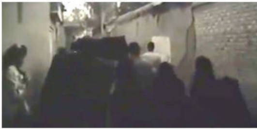
شکل ۱۰. مراسم تشییع (ماخذ: فیلم خشت و آینه، دقیقه ۱۳۸.۲۲)