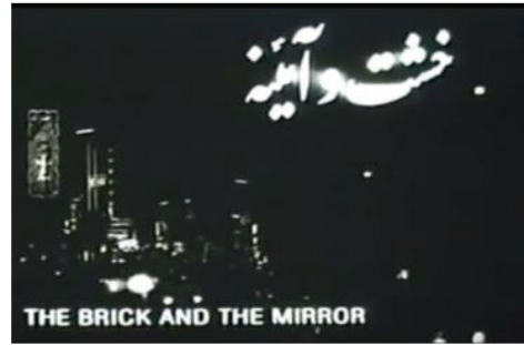
شکل ۳. تصویری از شب تهران