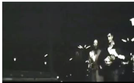
شکل ۵. پرسه‌زنی در شب (ماخذ: فیلم خشت و آینه، دقیقه ۴۰.۱۵)

کت و شلوار و عینک و دارای ظاهری موجه می‌خواهد که برای او دادخواستی بنویسد. مرد پس از شنیدن داستان، هاشم را از این کار منع می‌کند؛ برای او استدلال می‌کند که «امروز روز بی‌کسیه. تو وضع مالی نسبتاً خوبی داری و در قید خانواده هم نیستی؛ بهتر است جای اینکه خود را به دردسر بیندازی، کودک را به شیرخوارگاه تحویل دهی و خرجی که قرار است برای او بکنی برای عیش و نوش خود خرج کنی.» تعریفی تازه از فرد ارائه می‌شود، عنصری منفرد که لازم است خود را بیابد و تنها به خود کمک کند شکل ۸. قطعه روز بی‌کسی و فانی بودن همه‌چیز، بازتعریفی از دگردیسی ارزش‌های مرسوم است؛ سنت همیاری جای خود را به بی‌تفاوتی می‌دهد.