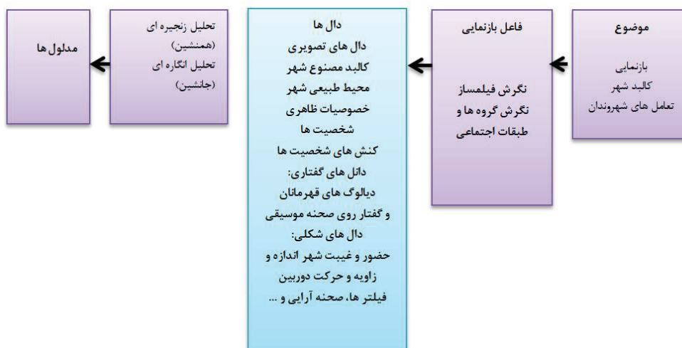
شکل ۲. مدل مفهومی پژوهش

موضوع بازنمایی: در یک تقسیم‌بندی کلی «موضوع بازنمایی» در اینجا شهر را می‌توان ترکیبی از دو مؤلفه دانست: «کالبد شهر» و «تعامل‌های میان انسان‌ها و میان انسان و شهر». در واقع با استفاده از این دو مؤلفه می‌توان تصویرهای گوناگون از شهر را از هم تمیز داد. از آنجا که مؤلفه اول بر کیفیت حضور و نمایش فیزیک شهر و مؤلفه دوم بر درک فیلم ساز از معنای شهر تأکید دارد، تلاش نگارنده بر آن بوده است تا با در نظر گرفتن هر دو عامل یاد شده، تصویرهای شهر و جامعه را در آثار سینمایی ایرانی شناسایی و تحلیل نمایند. هر دو عنصر «فاعل بازنمایی» و «موضوع باز نمایی» را می‌توان از یک نگاه دیگر تجزیه کرد. بدیهی است که موضوع بازنمایی ترکیبی است از: (۱) عناصر بی‌جان طبیعی و مصنوع که مثلاً می‌تواند ساختمان‌ها، خیابان‌ها و یا دیگر عناصر کالبدی مصنوع و یا احیاناً درختان، دریاچه ها، باران، رعد و برق و یا سایر عناصر طبیعی باشد. و (۲) موجودات زنده (مهم تر از همه انسان‌ها) به طور فردی و در گروه و کنش‌ها و تعامل‌های آنها. این تعامل‌ها در چارچوب نهادها، ارزش‌ها و هنجارها انجام می‌شوند که در مجموع حیات اجتماعی (و در کار ما حیات