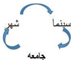
شکل ۱. نسبت شهر، سینما و جامعه