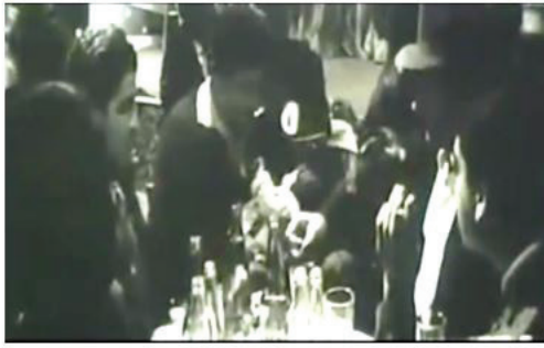
شکل ۴. خشت و آینه (هاشم در کافه)