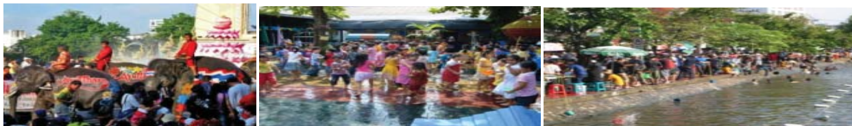
شکل ۷. نمونه موردی، جشنواره سونگگران در ایالت چیانگ مای تایلند