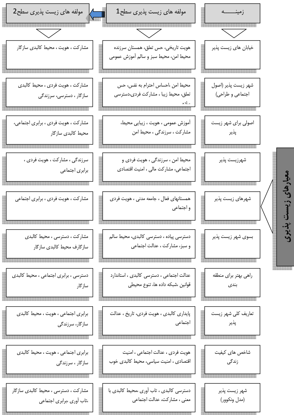
شکل ۱. تحلیل قیاسی معیارهای زیست پذیری برای دستیابی به مدل مفهومی

به نظر می رسد. از دیدگاه «مرسر» اصطلاح کیفیت زیست ۳۴ با اصطلاح کیفیت زندگی متفاوت است و در واقع منظور مرسر کیفیت زیست بوده و این شاخص ها به صورت عینی، خنثی و بدون تعصب بیان شده اند. کیفیت زندگی درباره حالت احساسی شخص و زندگی