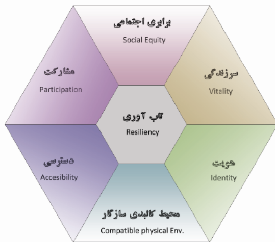
شکل ۲. مدل مفهومی پیشنهادی؛ مولفه های تشکیل دهنده زیست پذیری

در این تحقیق ضمن بررسی شاخص های مطرح شده در زمینه های زیست پذیری و ارتباط میان مفاهیم مشابه در شهرسازی و مفهوم زیست پذیری، از طریق رمزگذاری نظری و تحلیل محتوا سعی در شکل دهی انتظام مباحث در قالب مدل گردید. اکنون مدل مفهومی شهر زیست پذیر یعنی مولفه های شش گانه زیست پذیری در قالب یک مفهوم شناور قابل پیشنهاد است. مسأله با اهمیت دیگر این است که در کنار زیست پذیری مولفه دیگری وجود دارد که در ارتباط مستقیم با آن قرار گرفته و از آن پشتیبانی می کند. این مولفه همان گونه که در بخش های پیشین نیز اشاره شد «تاب آوری» نام دارد و می تواند در کنار ۶ مولفه فوق به عنوان مولفه پشتیبان یا فوق مولفه شناخته شود. طبیعتاً شهری که در مقابل بلایای طبیعی یا بحران های مختلف تاب آور نباشد، از قابلیت زیست پذیری چندانی برخوردار نخواهد بود. بحث تاب آوری هم به لحاظ پشتیبانی مولفه های زیست پذیری و هم پشتیبانی از مولفه های شکل شهر حائز اهمیت بوده و به نظر می رسد که نقش آن در خلق فرآیند زیست پذیری غیرقابل انکار است. بنابراین مدل مفهومی مورد نظر در قالب ۶ مولفه و یک فوق مولفه یا مولفه پشتیبان مطابق شکل ۲ خواهد بود.