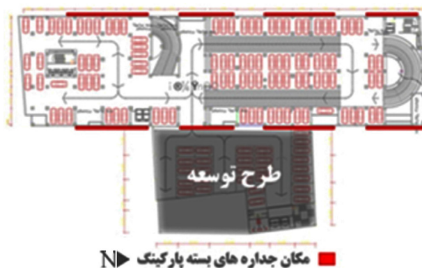
شکل ۴. طراحی بسته و متراکم در جداره‌های پارکینگ

خیابان بوعلی در مرکزیت شهر قرار گرفته که به لحاظ تراکم جمعیتی و ترافیکی در زمره پرازدحام ترین مناطق شهری جای دارد. احداث