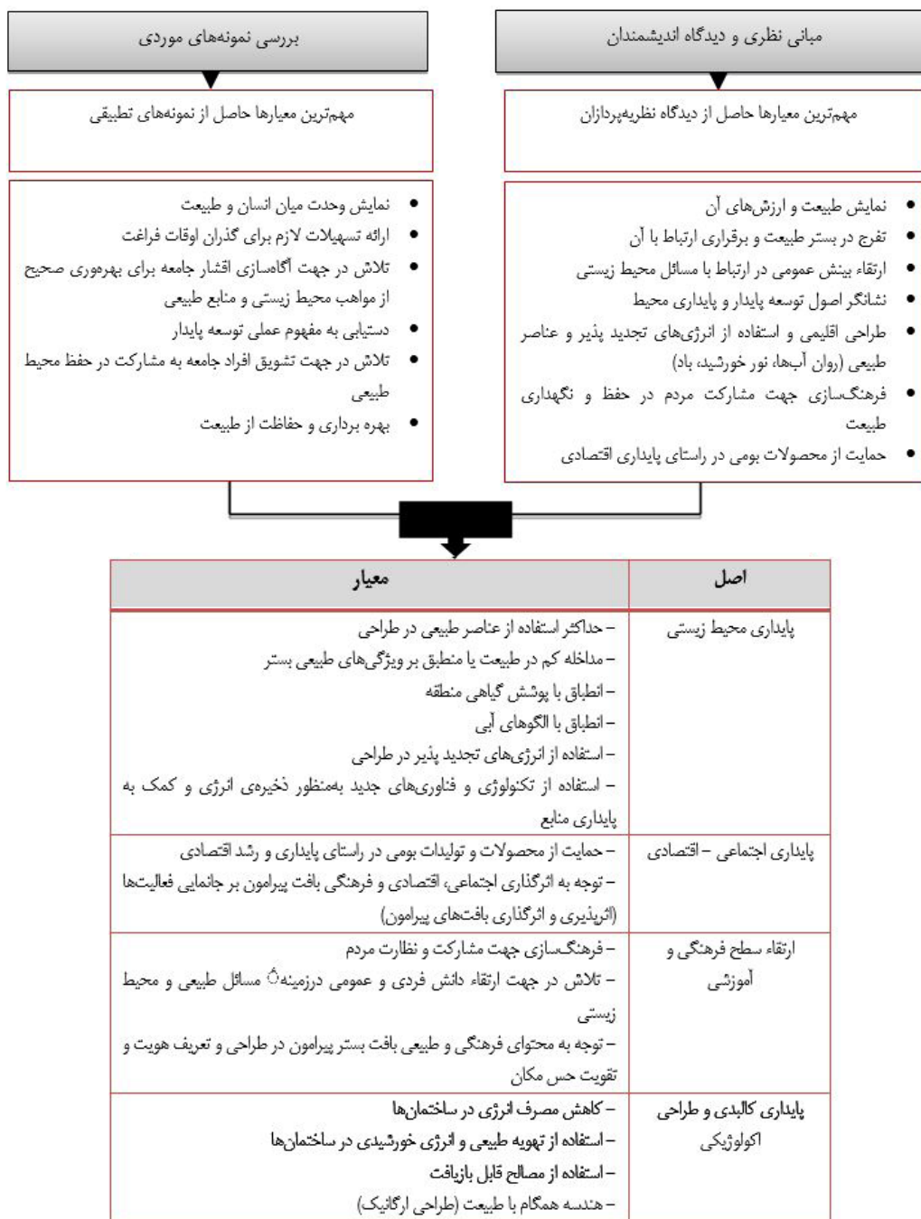
شکل ۲. مهم‌ترین معیارهای اکوپارک

مورد این نوع پارک‌های موضوعی ارائه نمود که پشتوانه عملکرد و موفقیت نهایی آن‌ها به شمار می‌آید. در این راستا بر اساس تحلیل‌های انجام‌شده در بخش قبل می‌توان مهم‌ترین معیارهای طراحی اکوپارک‌ها که آن‌ها را از سایر پارک‌های صرفاً منظری متمایز می‌سازد، با توجه به شکل ۲، عنوان نمود. در تنظیم چارچوب نهایی در جهت دستیابی به معیارهای جامع،